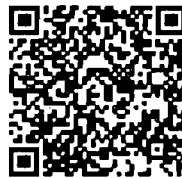
สำนักrayงาน การประชุมและตัวเลข