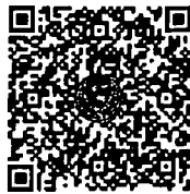
หนังสือนัดประชุม และระเบียบวาระการ ประชุมร่วมกันของรัฐสภา

เอกสารประกอบการประชุมร่วมกันของรัฐสภา ได้เผยแพร่ทางสื่ออิเล็กทรอนิกส์ ตามข้อบังคับการประชุมรัฐสภา พ.ศ. ๒๕๖๓ ข้อ ๑๓ โดยท่านสมาชิกฯ สามารถอ่านเอกสารประกอบการประชุมได้ โดยการสแกน QR code หรือทาง www.parliament.go.th