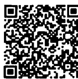
บันทึกการประชุมสภา สำนักrayงาน การประชุมและขอเลข