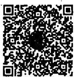
หนังสือนัดประชุม และระเบียบวาระการประชุม ร่วมกันของรัฐสภา

เอกสารประกอบการประชุมร่วมกันของรัฐสภา ได้เผยแพร่ทางสื่ออิเล็กทรอนิกส์ ตามข้อบังคับ การประชุมรัฐสภา พ.ศ. ๒๕๖๓ ข้อ ๑๓ โดยท่านสมาชิกฯ สามารถอ่านเอกสารประกอบการประชุมได้ โดยการสแกน QR code ที่ปรากฏอยู่ในหนังสือนัดประชุม หรือทาง www.parliament.go.th