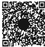
หนังสือนัดประชุม และระเบียบวาระการ ประชุมร่วมกันของรัฐสภา

เอกสารประกอบการประชุมร่วมกันของรัฐสภา ได้เผยแพร่ทางสื่ออิเล็กทรอนิกส์ ตามข้อบังคับ การประชุมรัฐสภา พ.ศ. ๒๕๖๓ ข้อ ๑๓ โดยท่านสมาชิกฯ สามารถอ่านเอกสารประกอบการประชุมได้ โดยการสแกน QR code หรือทาง www.parliament.go.th