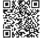
เอกสารประกอบ การพิจารณา สำนักวิชาการ