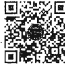
กระทู้ถามสด ด้วยวาจา