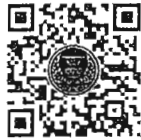
หนังสือนัดประชุม และระเบียบวาระการประชุม สภาผู้แทนราษฎร

การนัดประชุมได้แจ้งให้สมาชิกทราบทางสื่ออิเล็กทรอนิกส์เรียบร้อยแล้ว และท่านสมาชิกสามารถ อ่านเอกสารประกอบการประชุมสภาผู้แทนราษฎรได้ โดยการสแกน QR Code หรือทาง www.parliament.go.th