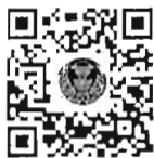
หนังสือนัดประชุม และระเบียบวาระการประชุม สภาผู้แทนราษฎร

สมาชิกสภาผู้แทนราษฎรสามารถอ่านและดาวน์โหลดเอกสารประกอบการพิจารณาได้โดยการสแกน QR Code หรือทาง www.parliament.go.th