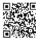
บันทึกการประชุมสภา สำนักrayงาน การประชุมและตัวเลข