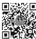
กระตุ้นถามสด ด้วยวาจา