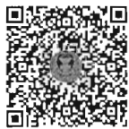
หนังสือนัดประชุม และระเบียบวาระการ ประชุมร่วมกันของรัฐสภา

๒. รายงานการประชุมร่วมกันของรัฐสภา (สมัยสามัญประจำปีครั้งที่สอง) ครั้งที่ ๑ - ๒ ได้วางให้ท่านสมาชิกฯ ตรวจสอบเมื่อวันศุกร์ที่ ๑๙ สิงหาคม ๒๕๖๕ และ ครั้งที่ ๓ - ๔ ได้วางให้ท่านสมาชิกฯ ตรวจสอบเมื่อวันจันทร์ที่ ๒๙ สิงหาคม ๒๕๖๕ บริเวณหน้าห้องประชุมสภาผู้แทนราษฎร ชั้น ๒ สำนักงานเลขาธิการสภาผู้แทนราษฎร และห้องรับรองสมาชิกวุฒิสภา ชั้น ๒ สำนักงานเลขาธิการวุฒิสภา ก่อนเสนอให้ที่ประชุมร่วมกันของรัฐสภา รับรอง รวมถึงจัดให้มีข้อมูลในรูปแบบหนังสืออิเล็กทรอนิกส์ เพื่อให้สมาชิกฯ ตรวจสอบดูรายงานการประชุมได้ตามที่ร้องขอ ตามข้อบังคับฯ ข้อ ๒๓ วรรคหนึ่ง