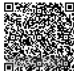
ดาวน์โหลดเอกสารประกอบ การประชุมวุฒิสภา ครั้งที่ ๓