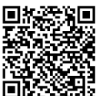
ดาวน์โหลด หนังสือนัดประชุมวุฒิสภา