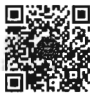
กระทู้ถามสด ด้วยวาจา