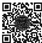
หนังสือนัดประชุม และระเบียบวาระการประชุม สภาผู้แทนราษฎร

เอกสารประกอบการประชุมสภาผู้แทนราษฎร ได้เผยแพร่ทางสื่ออิเล็กทรอนิกส์ ตามข้อบังคับฯ ข้อ ๒๑ วรรคหนึ่ง เรียบร้อยแล้ว โดยท่านสมาชิกฯ สามารถอ่านเอกสารประกอบการประชุมได้ โดยการสแกน QR Code หรือทาง www.parliament.go.th